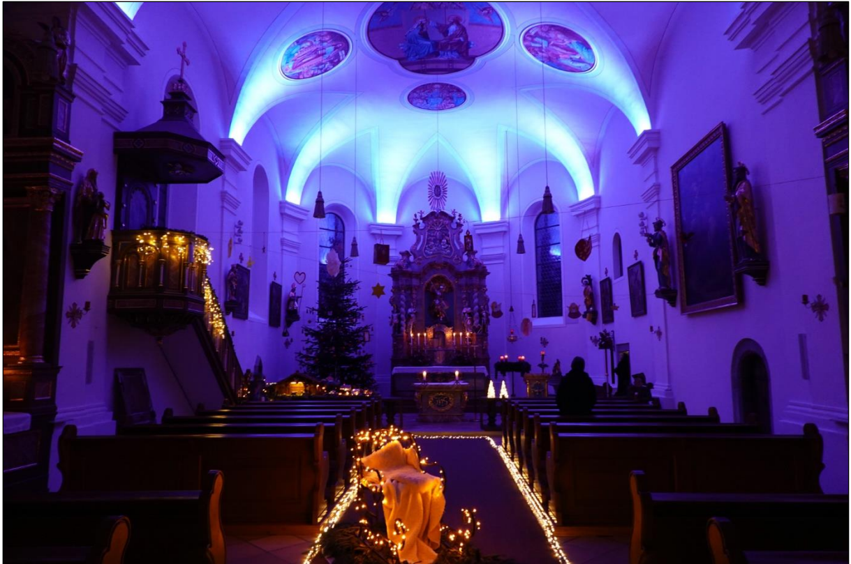
Die wunderbar beleuchtete Pfarrkirche St. Georg in Prackebach