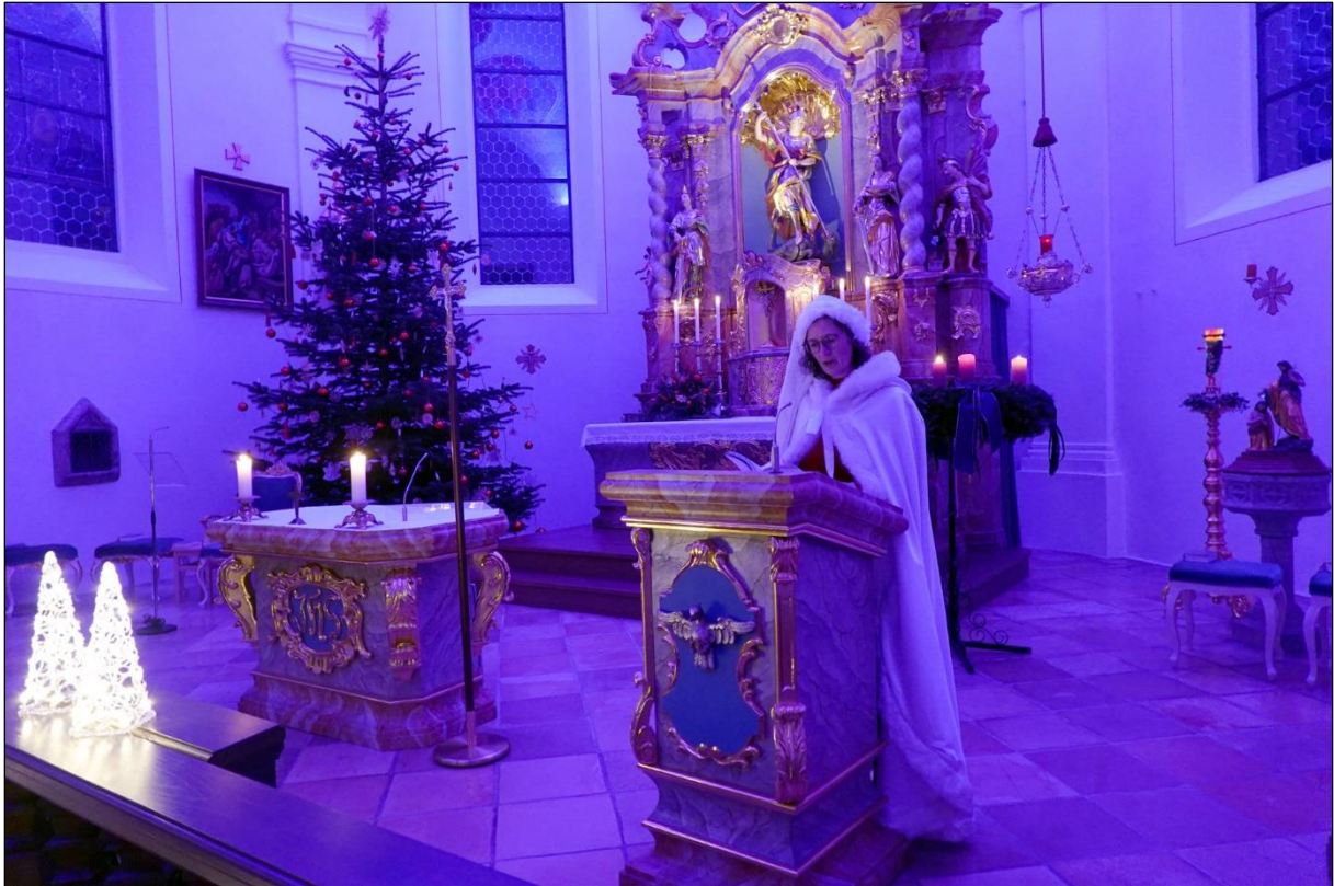
Kirchenmusikerin Ulrike Altmann sprach die verbindenden Texte zwischen den Musikstücken.