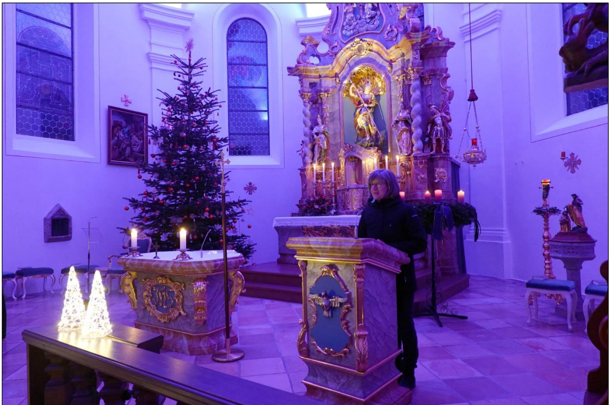
PGR-Sprecherin Margit Eidenschink bedankt sich am Ende des weihnachtlichen Abendlobes für die wunderbaren Darbietungen.