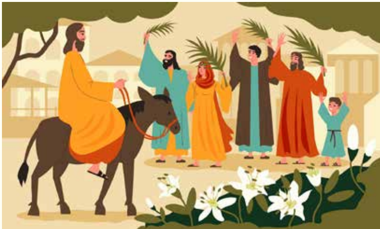
Bild: Freepik.com". Dieses Cover wurde mit Ressourcen von Freepik.com erstellt.